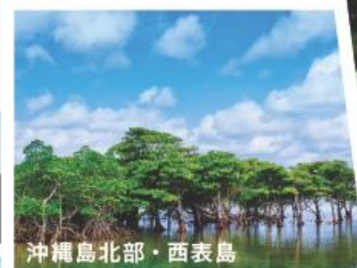
沖縄島北部・西表島