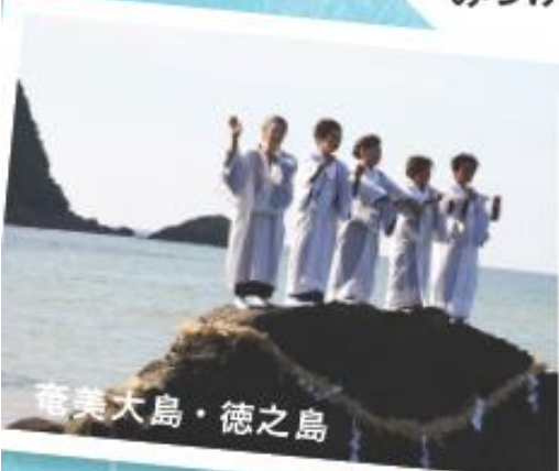
奄美大島・徳之島