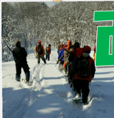
鳥獣害対策、ジビエ推進