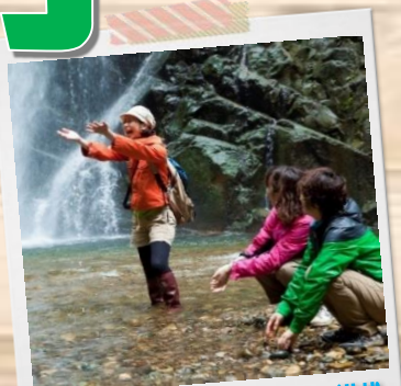
自然を楽しむアクティビティ満載